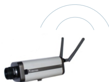
Kamera s AP